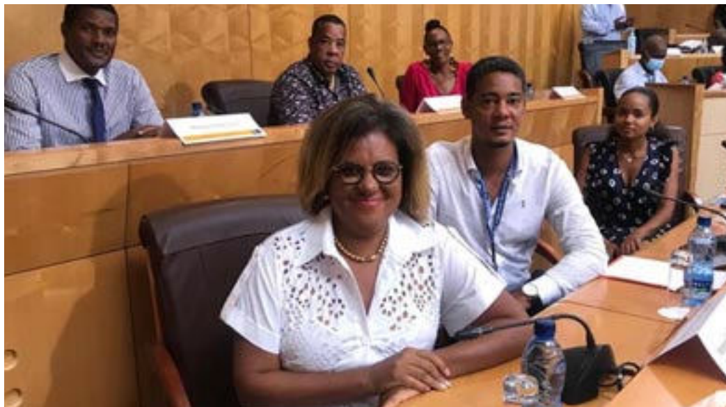
Les 6 élus à la CTM

Les 6 élus à la CTM forment le seul groupe d'opposition à avoir répondu à la demande de Serge Letchimy, qui invitait les groupes d'élus de l'Assemblée, à faire des propositions pour répondre aux attentes profondes des Martiniquaises