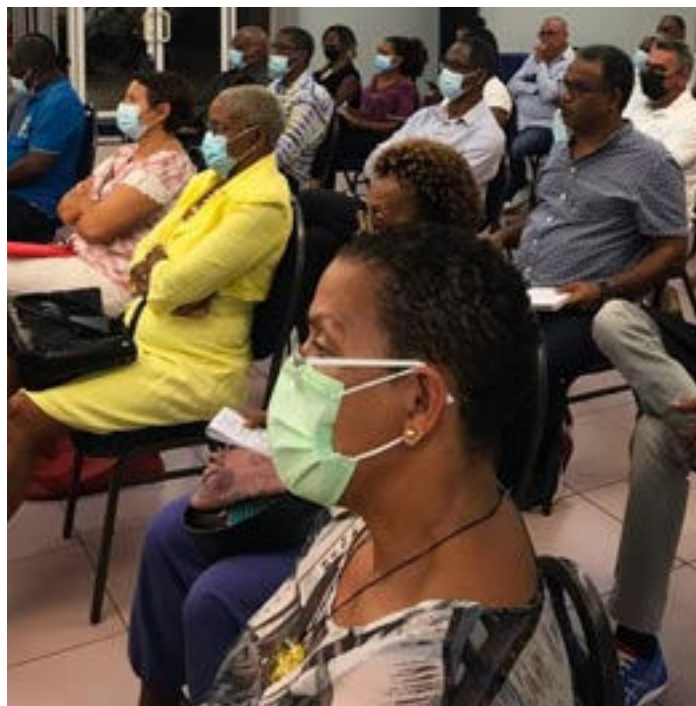
La formation comme crédo

Des élections présidentielles pour lesquelles LME n'a pas encore pris position, mais on peut imaginer une liberté de choix laissée aux électeurs, compte-tenu du fait que les membres ont parrainé Anne Hidalgo, Valérie Pécresse, Christiane Taubira, Yannick Jadot et Emmanuel Macron.