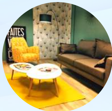
La Maison de la cancérologie à Montgérald, Fort de France