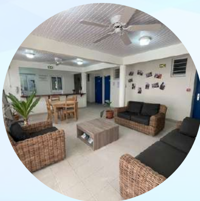
La Maison d'Accueil des Patients et des Proches sur le site de l'Hôpital Albert Clarac Fort de France