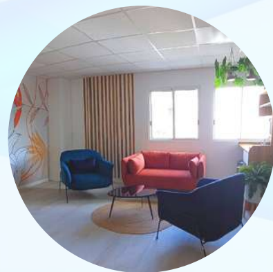
L'Espace Ligue* Résidence La Mouina à Redoute Fort de France