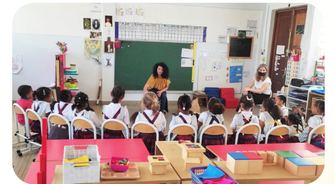
Petits souvenirs de l'édition 2022.