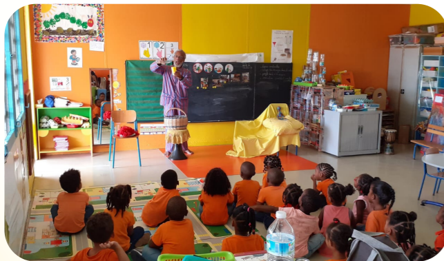
Petits souvenirs de l'édition 2022.