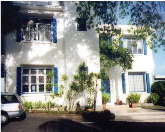
This villa is where the head of the U.S. consular post resided, in the Didier suburb of Fort-de-France, 1993.