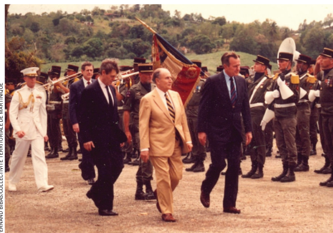
Presidents François Mitterrand and George H.W. Bush at Habitation Clément, Martinique, on March 14, 1991.

On Dec. 8, 1940, while conducting an inspection cruise in the West Indies aboard the USS Tuscaloosa , President