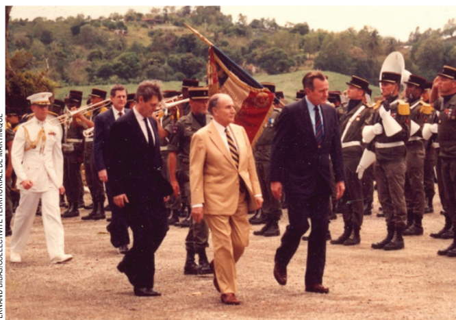
Les présidents François Mitterrand et George H.W. Bush à l'Habitation Clément, Martinique, le 14 mars 1991.

Le 8 décembre 1940, alors qu'il effectuait une croisière d'inspection aux Antilles à bord de l'USS Tuscaloosa, le président