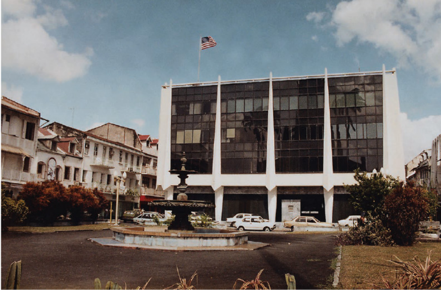
The U.S. Consulate Office Building in Fort-de-France in 1983. This building, which still exists today, is located in front of the Saint-Louis Cathedral.

reputation as humanists where color was concerned. However, there is color prejudice in Martinique. Césaire, communist deputy [Aimé Césaire was also a famous writer and intellectual. —Au.], has made several appeals to electors by raising the color question. This appeal is based on the fact that the wealth of the island is concentrated in hands of whites whereas political power is entirely in hands of Negroes—in the case of Martinique, in the hands of negro communists.”