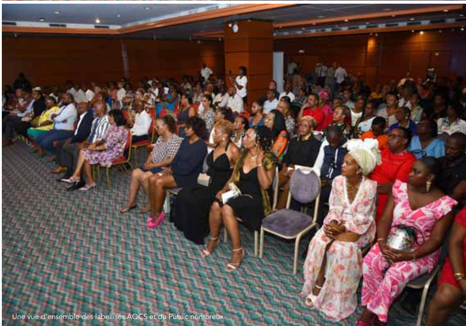
Une vue d'ensemble des labellisés AQCS et du Public nombreux