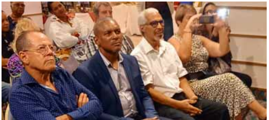
➤ Au premier rang