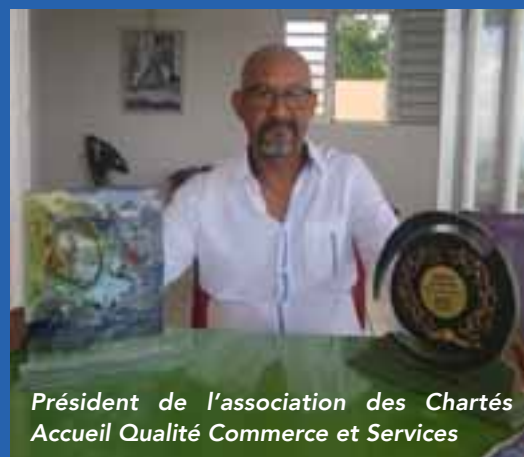
Président de l'association des Chartés Accueil Qualité Commerce et Services