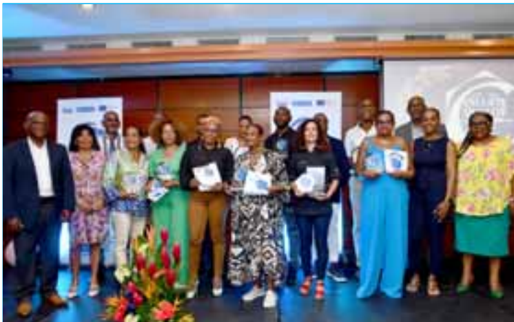
Les commerçants ayant reçus les prix spéciaux avec les élus des trois EPCI